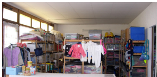
Centre de La Tour-de-Peilz