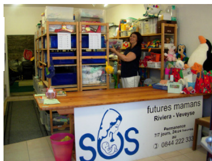
Centre de Châtel-St-Denis